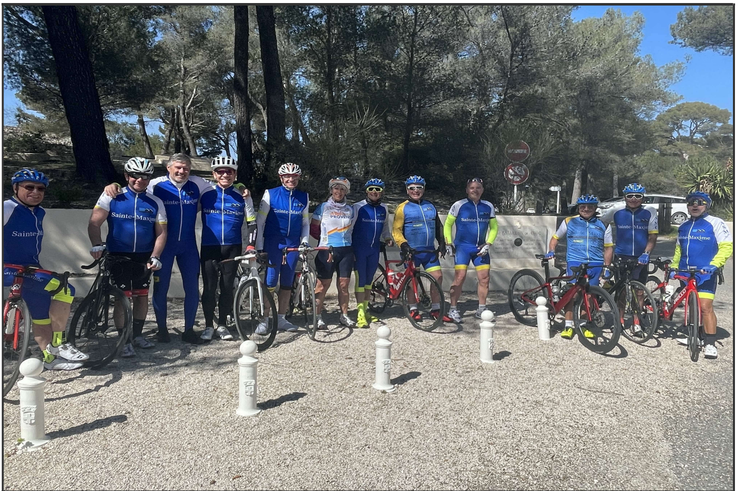
Les 12 participants à cette 1 ère C.L.D

Après ce très bon moment de convivialité, il était temps de repartir mais avant cela il fallait immortaliser le moment.