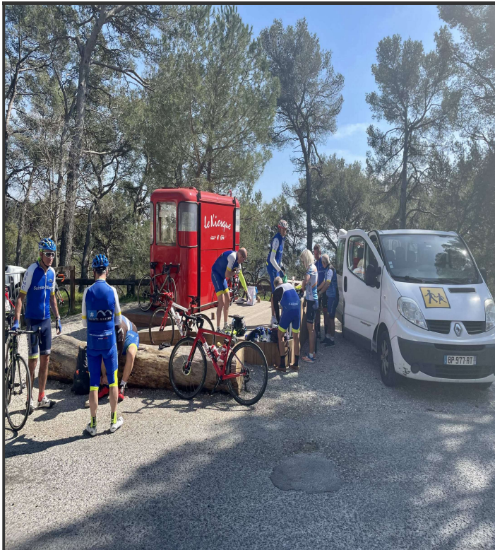
Le groupe se prépare pour le départ