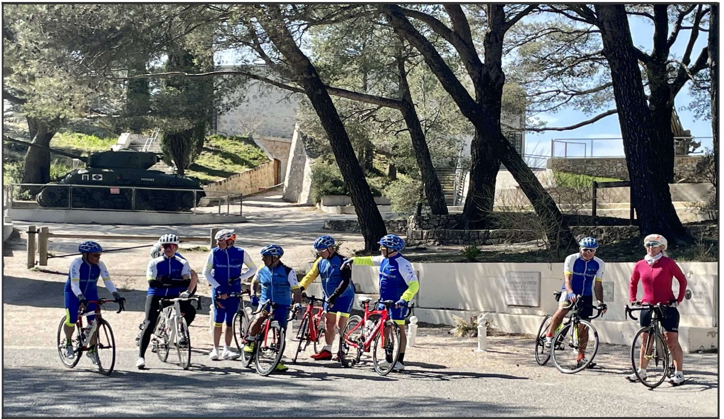
Le groupe prêt à repartir