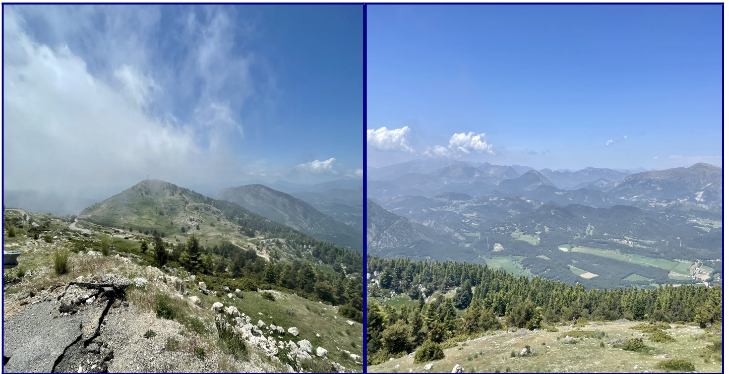
Vues panoramiques (photos prises à l'endroit du pique-nique)