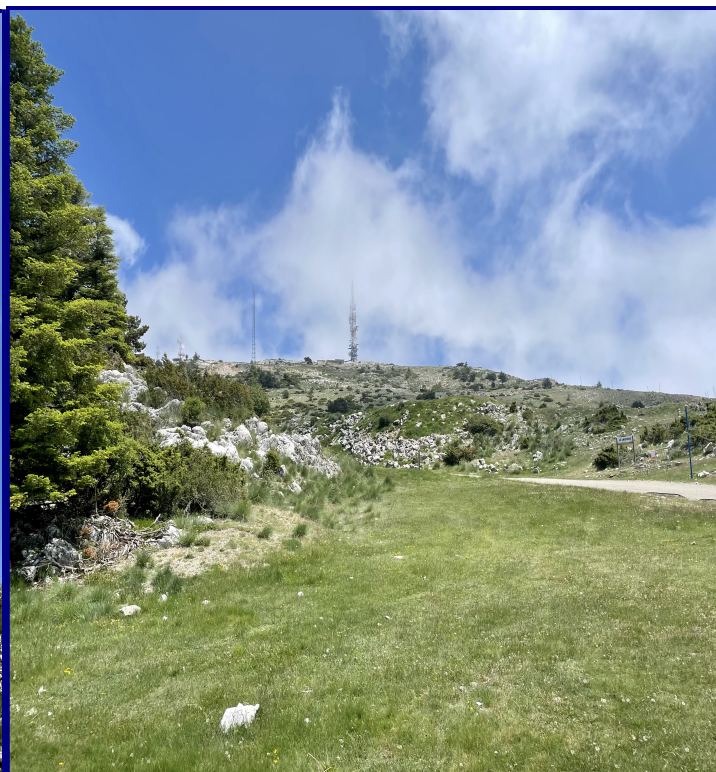
Le sommet de la montagne du Lachens