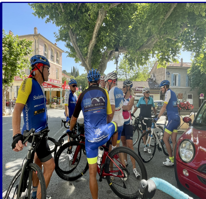
Le groupe prêt à grimper le 1 er col de la journée

Après Callas, nous avons donc enchaîné par le col de Boussaque, qui a une longueur de 3,6 km avec un % moyen de 4,3% ce qui nous a amené au très beau village de Bargemon.