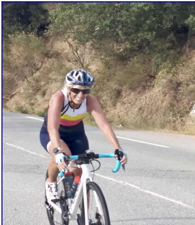
Madée tout sourire au sommet du col du Bel Homme

En conclusion, nous avons passé une superbe journée avec une météo au top, un très bon groupe, dans lequel figurait une féminine qui a fait une très belle sortie.